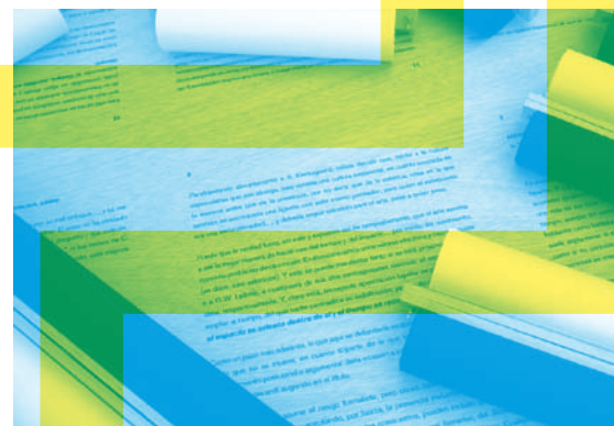
Isidoro Valcárcel Medina. Cuándo, dónde... y si es preciso, cómo , 2011 (detall)