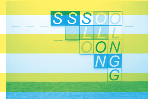
Joe Scanlan, SolongSolSolong , 2007