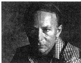
El novel·lista Michel Houellebecq

mapa i el territori , que es publicarà aviat a casa nostra, narra la història de personatges sense futur —un pintor que es fa famós, una bella editora russa, un detectiu de policia—, entre els quals es retrata a ell mateix, un recurs arriscat i transgressor que li acaba funcionant. Una novel·la rodona amb l'obsessió per l'envelliment i la mort, a la manera de Philip Roth. Houellebecq retrata també amb ironia i coneixement de causa el mercat de l'art contemporani a França i la vanitat dels artistes i dels seus agents i dels