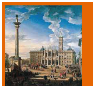
GIOVANNI PAOLO PANINI Santa Maria Maggiore, 1744 PALAZZO QUIRINALE, ROMA

Malgrat que també va ser un bon retratista i muralista, Panini es va especialitzar en vedute de Roma. Com sol passar en aquest gènere, l'artista solia barrejar ficció i realitat en les seves imatges de carrers, places, monuments i espais arqueològics de Roma. Es tractava d'embellir la ciutat (encara més, si és possible) per satisfer la demanda de turistes pioners (la majoria anglesos i alemanys) que visitaven Itàlia com a bressol de la civilització