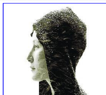
title=""Somnia_3" d'Étienne de Massy explora el flux entre espai i temps.

Malgrat i haver entregat els premis, el Festival internacional de vídeo i arts digitals 2009 continua. La Casa de Cultura, la Mercè i el Niu del Bòlit a la Rambla exposen fins el proper 25 d'octubre totes les obres guanyadores, a més d'activitats obertes als amants de l'art digital.