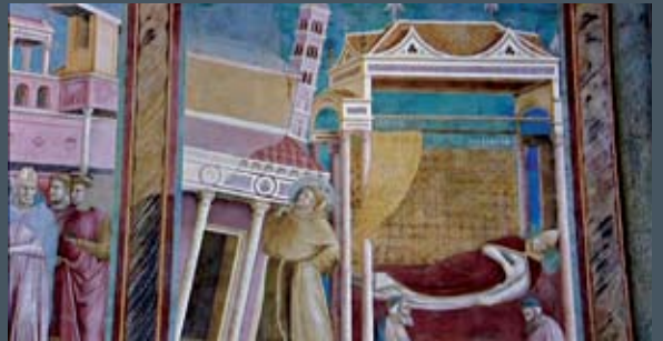
Giotto. Inocencio III durmiendo, frescos de la iglesia superior de la Basílica de San Francisco de Asís, S. XIII-XIV

de imágenes sobre los desfiles de la victoria tras la Guerra del Golfo en la ciudad de Nueva York, y al otro, The War Room (2005), un documental en torno al desarrollo de videojuegos de guerra por parte del Institute for Creative Technologies en el marco del contrato suscrito entre las Fuerzas Armadas norteamericanas y la University of Southern California en 1999, al objeto de conseguir los recursos y talentos necesarios y trabajar con profesionales de la tecnología para avanzar en la